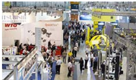
※写真は2枚とも視察先のイメージです。実際に訪問する展示会、工場ではありませんので、あらかじめご了承ください。